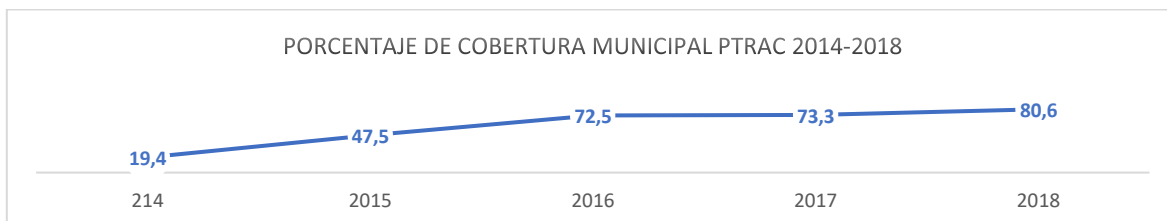
Cuadro 2. Aumento sostenido en la cobertura municipal de programa PTRAC entre 2014 y 2018. (DIPRES, 2019)

En razón de lo anterior, el año 2014, bajo el gobierno de la Presidenta Michelle Bachelet , se crea el Programa de Tenencia Responsable de Animales de Compañía PTRAC. Este programa responde a la necesidad de abordar la tenencia responsable desde el Estado, naciendo como programa piloto el 2014 y consolidándose durante los años siguientes , con un crecimiento gradual y sostenido en la cobertura a municipios (cuadro 2)